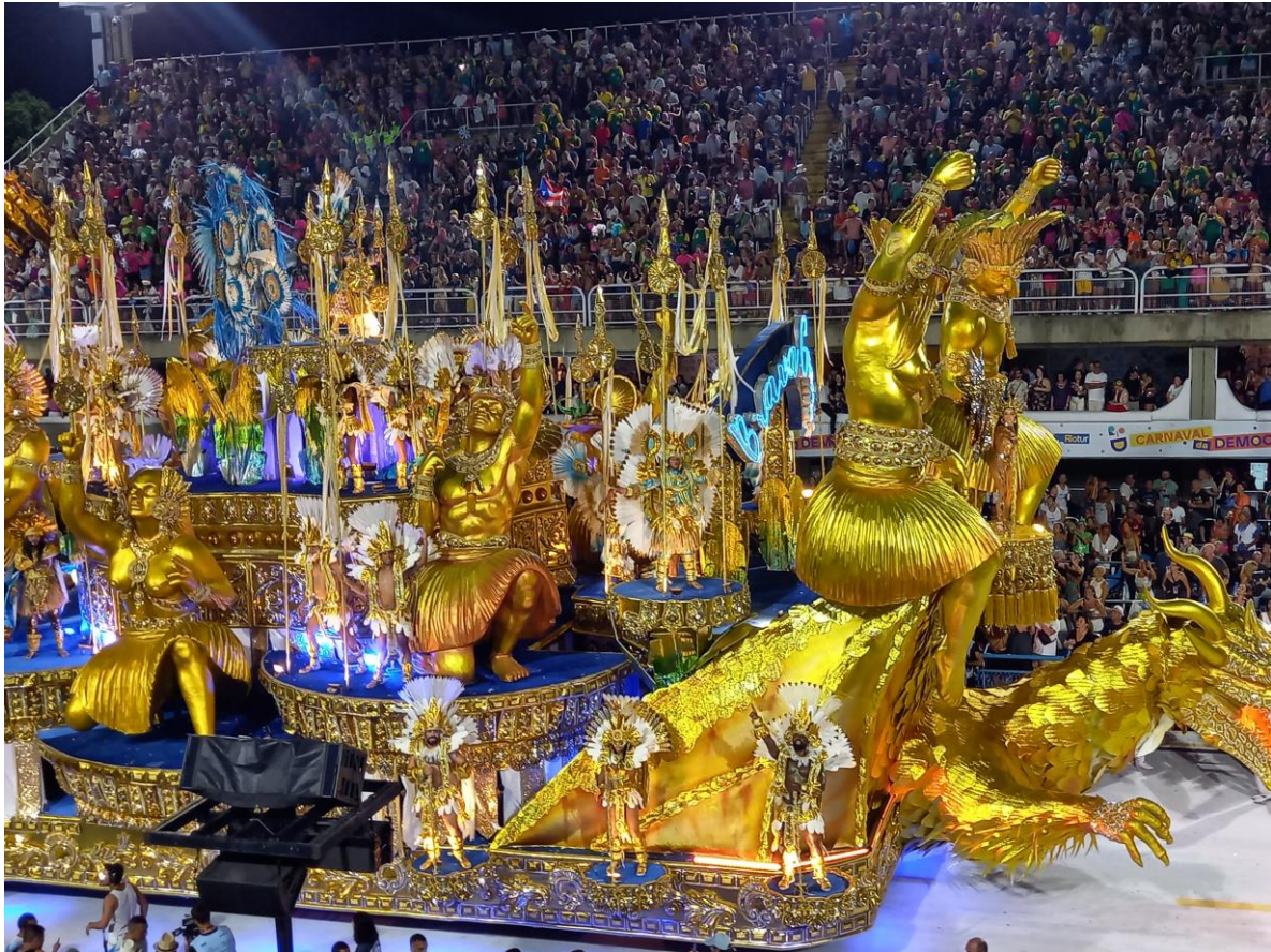
Char au sambódromo pendant le carnaval

Le Carnaval le plus typique et populaire est celui dans la rue où les différentes classes sociales se mélangent (Les Blocos). A Rio, il y a même des jours fériés pour que tout le monde puisse en profiter. Les informations des différents blocos sont publiées sur les réseaux sociaux (@blocosrj.official publiait un résumé des différents blocos ainsi que le point de rencontre). Il existe néanmoins de nombreux défilés non déclarés alors n'hésitez pas et profitez-en.