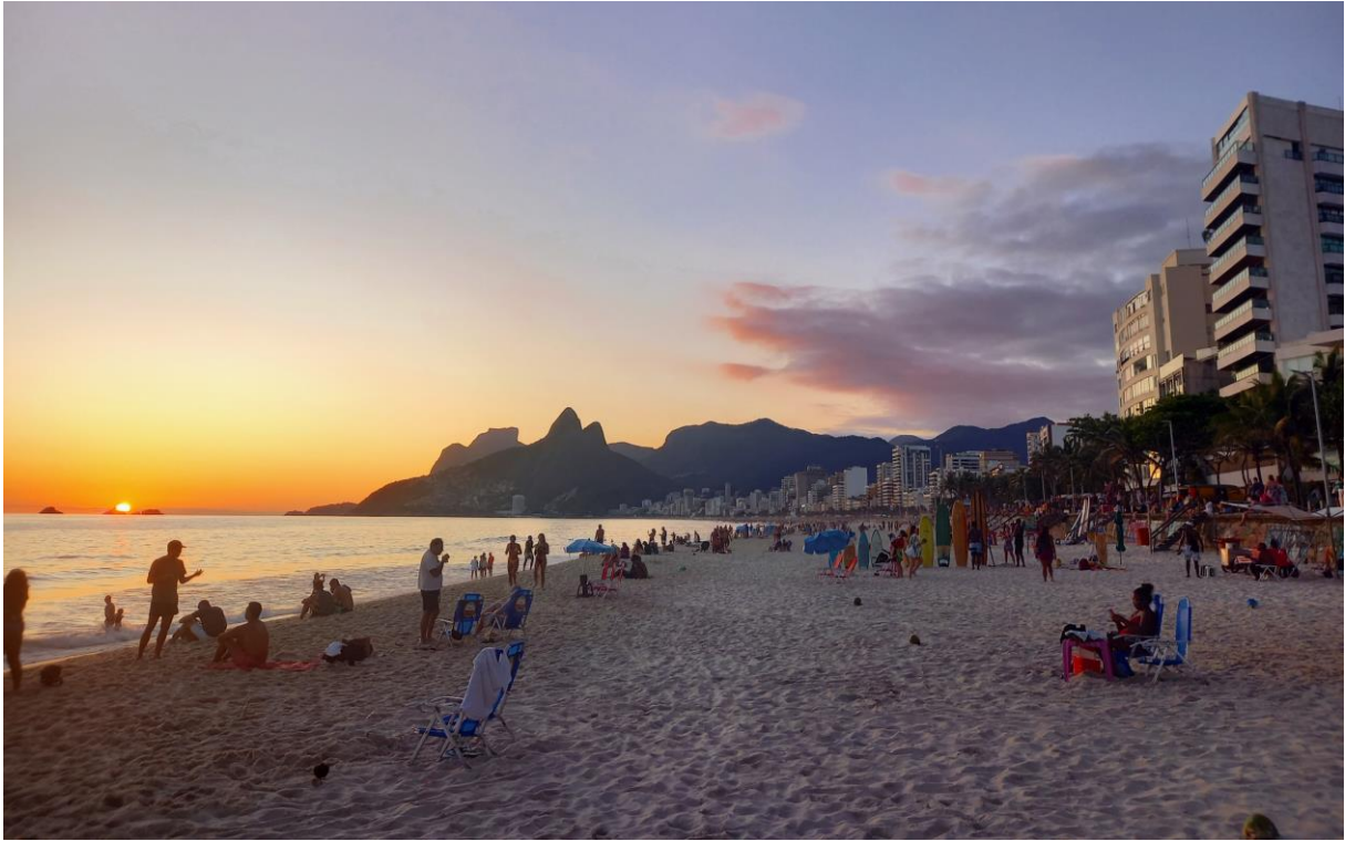
Plage d'Ipanema à Rio de Janeiro