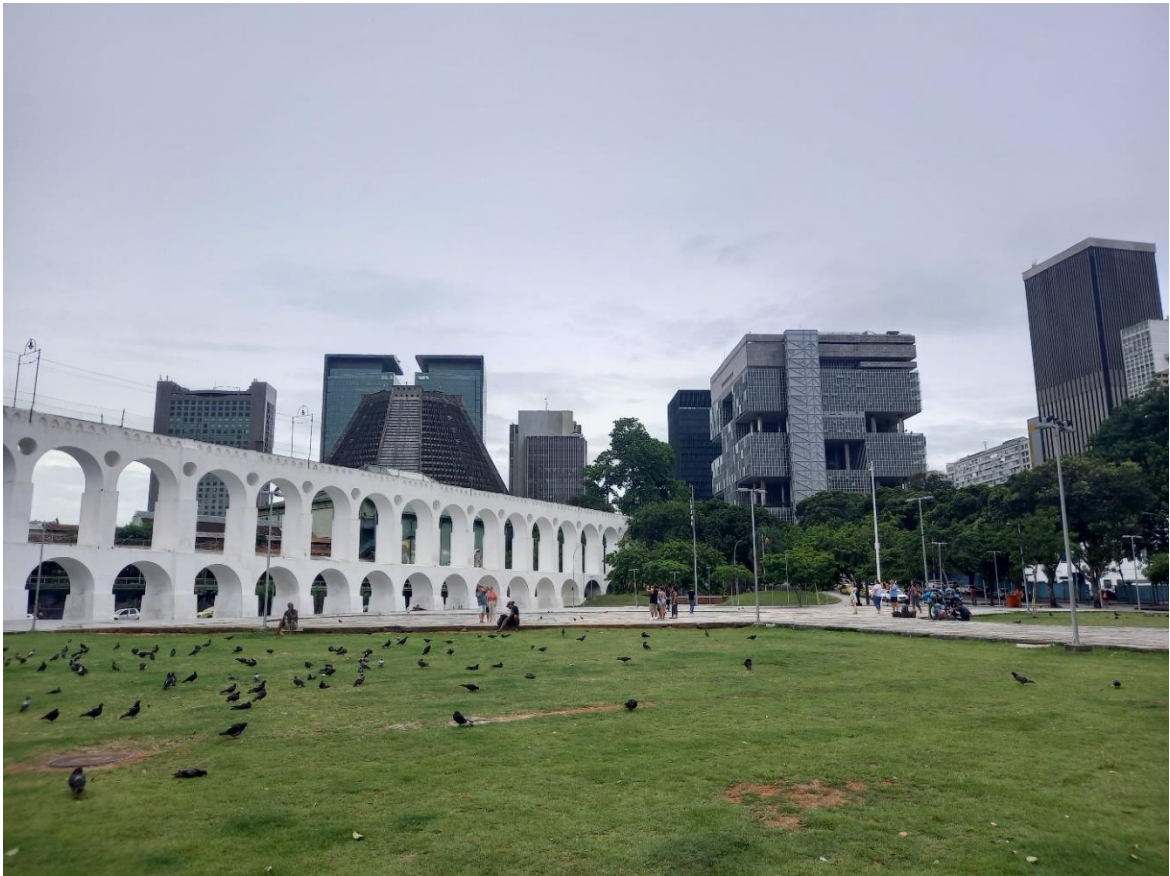
Arcos da Lapa et le district économique de Rio de Janeiro