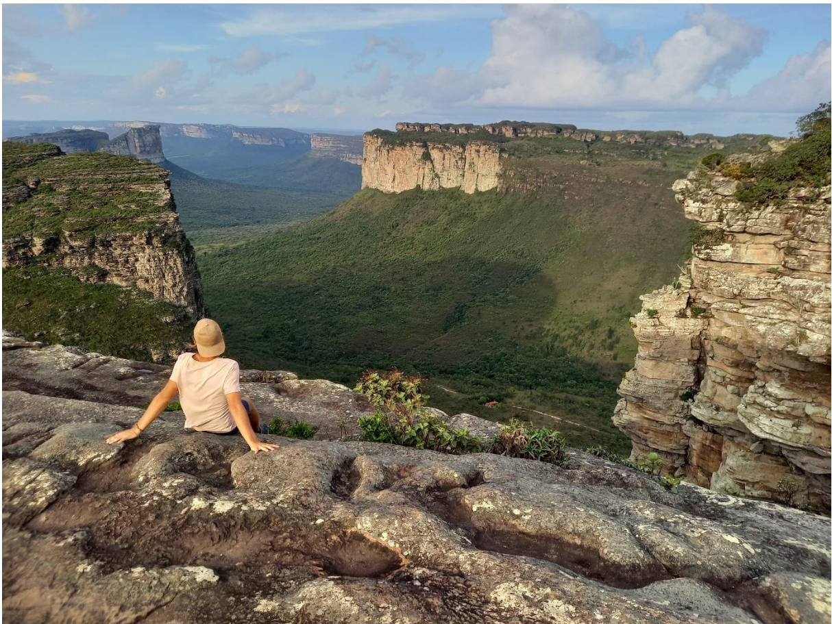
Morro do Pai Inácio au Parque Nacional da Chapada Diamantina