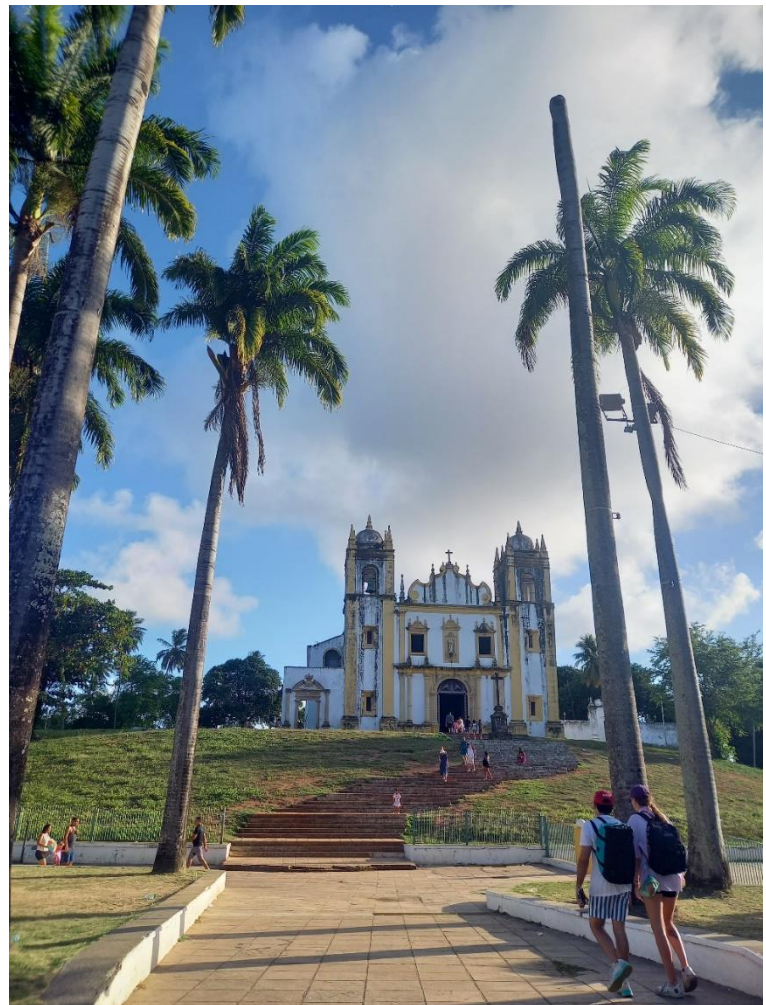
Eglise Nossa Senhora do Carmo à Olinda