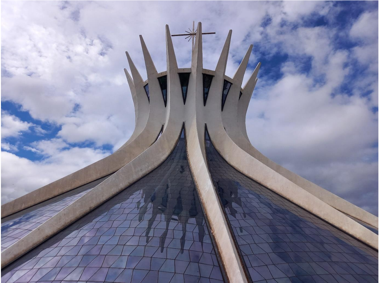
Cathédrale de Brasília construite par Oscar Niemeyer