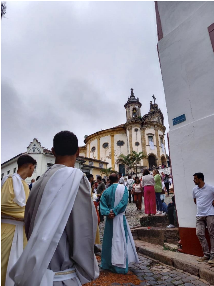
Semana Santa à Ouro de Preto