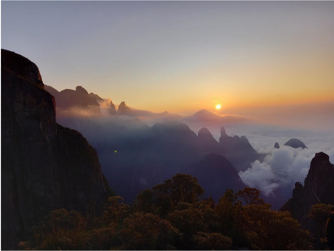
Travessia dans le Parque nacional Serra dos Órgãos