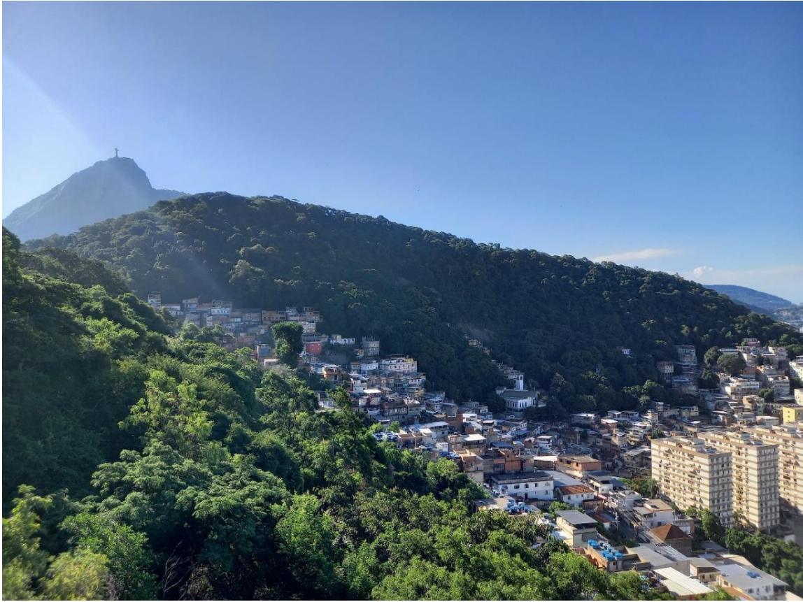
Vue sur Peixoto et le Corcovado depuis le Morro dos Cabritos